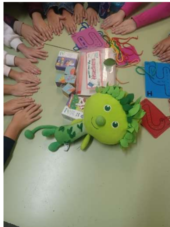
CON CARTULINAS DE COLORES, SE COSEN LETRAS.