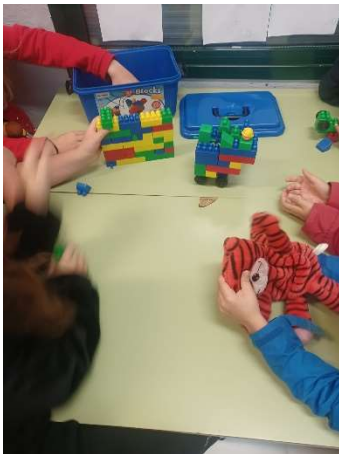
BLOQUES DE CONSTRUCCIÓN.

Cambiamos de ubicación en el colegio y se hacen juegos libres.