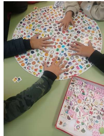
EL LINCE. CONSTA EN PONER UNA FICHA EN MEDIO Y ENCONTRARLA.